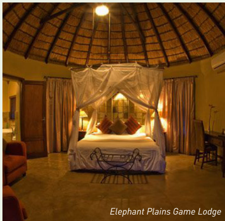
Elephant Plains Game Lodge