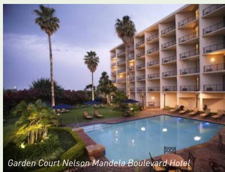
Garden Court Nelson Mandela Boulevard Hotel

Petit déjeuner suivi d'une journée sur la « Route des Vins » comprenant une dégustation de vins dans un domaine viticole, le lunch, le tour d'orientation de la charmante petite ville de Stellenbosch et le tour d'orientation de Franschhoek. Dîner traditionnel au Gold Restaurant. Garden Court Nelson Mandela Boulevard Hotel BB.