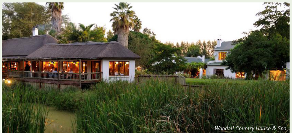
Woodall Country House & Spa