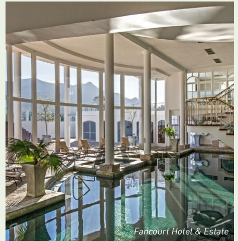
Fancourt Hotel & Estate