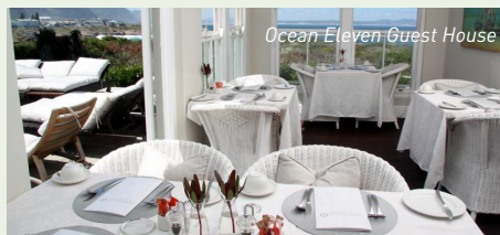
Ocean Eleven Guest House