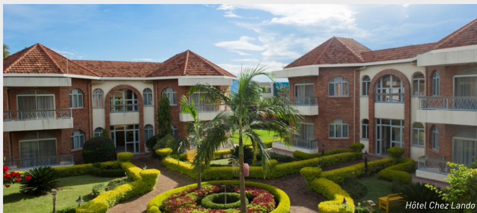
Hôtel Chez Lando

En alternative à une extension plage au départ de la Tanzanie ou du Kenya, nous vous proposons ici une expérience unique au monde: la découverte des gorilles des montagnes en Ouganda ou au Rwanda. Si vous désirez réaliser un circuit complet dans l'un de ses deux pays, veuillez vous référer à la section Ouganda à la page 61 et à la section Rwanda à la page 63.