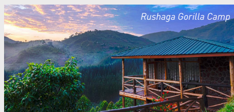
Rushaga Gorilla Camp