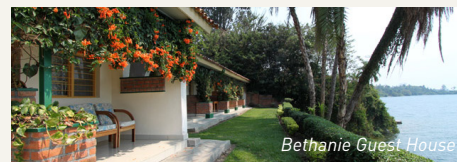
Bethanie Guest House