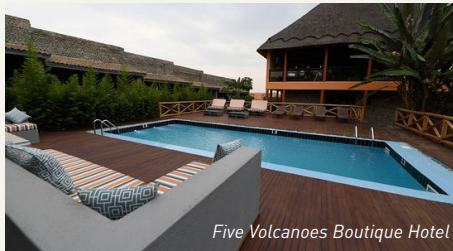
Five Volcanoes Boutique Hotel

Nous proposons aussi des programmes incluant le Parc National de l'Akagera.