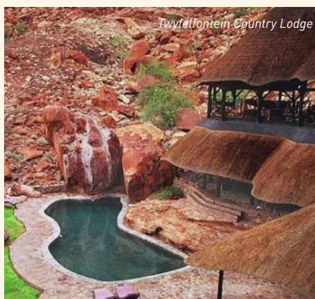
Twyfelfontein Country Lodge