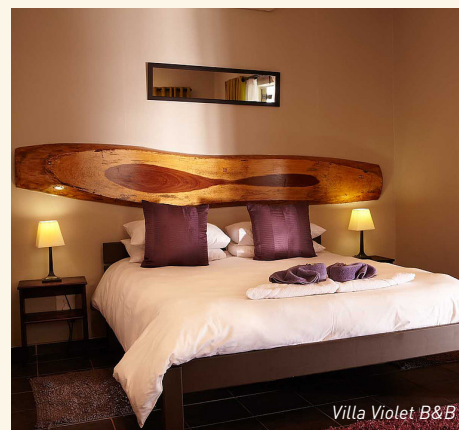
Villa Violet B&B