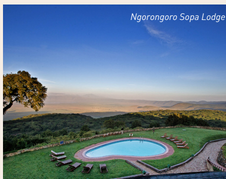
Ngorongoro Sopa Lodge