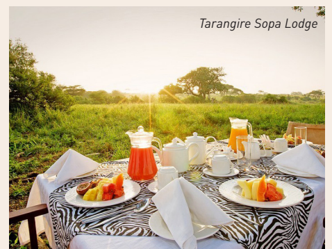
Tarangire Sopa Lodge