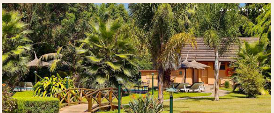
Arumeru River Lodge