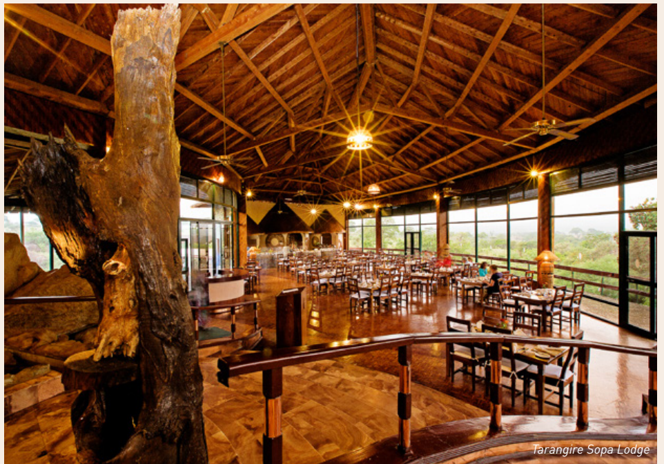
Tarangire Sopa Lodge