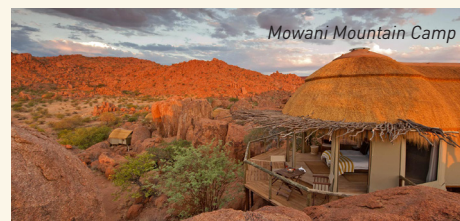
Mowani Mountain Camp