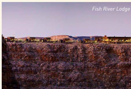
Fish River Lodge

Petit déjeuner suivi d'une excursion marine d'une demi-journée à la découverte des otaries à fourrure du Cap et des dauphins. Déjeuner. Dans l'après-midi, envol vers la région du Damaraland en remontant le Nord de la Skeleton Coast, en survolant les colonies d'otaries à fourrure du Cap, les épaves de bateaux sur la plage, le Cratère de Messun et les lits de rivières des cours d'eau éphémères. Mowani Mountain Camp DBB.