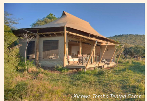
Kichwa Tembo Tented Camp