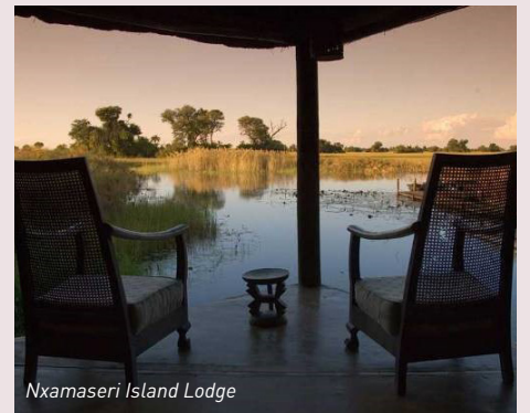
Nxamasere Island Lodge