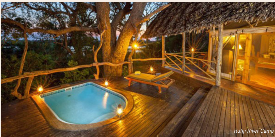
Rufiji River Camp