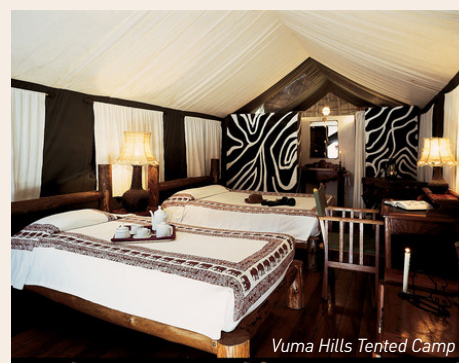
Vuma Hills Tented Camp