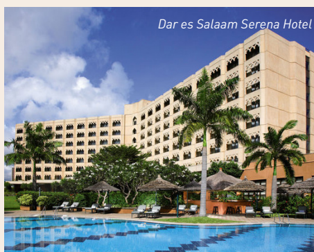
Dar es Salaam Serena Hotel